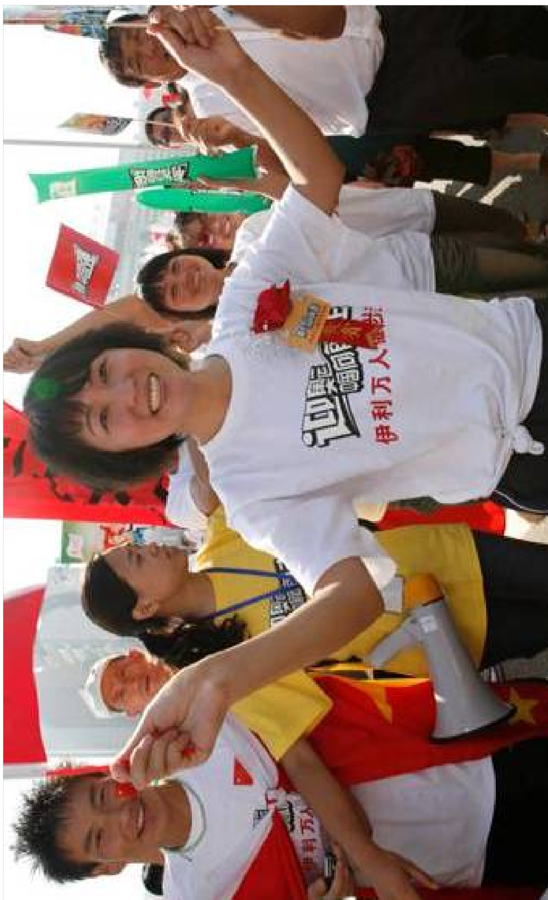
王军霞 ：我国历史上最出色的田径选手，1996年首次参加奥运会，以14分59秒88的成绩获得女子5000米金牌，并获女子10000米银牌，成为中国第一位获奥运会长跑金牌的运动员。她也是世界上第一位突破女子10000米跑“30分钟大关”的运动员，被誉为“东方神鹿”。